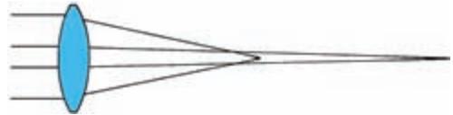
Abb. 3-20: Kugelgestaltsfehler bei einer Linse

Im Gegensatz zum Farbfehler kommt der Kugelgestaltsfehler ( sphärische Aberration ) auch beim Spiegelteleskop vor. Die beiden folgenden Abbildungen verdeutlichen den Effekt mit übertriebenem Maßstab. Die Oberflächen einer Linse beziehungsweise eines Spiegels sind Ausschnitte einer Kugelschale. Dabei zeigt sich, dass die Randzonen eine kürzere Brennweite besitzen als die achsennahen Zonen. In Folge dessen erhält man ein leicht verschwommenes Bild mit vermindertem Kontrast, wodurch sich auch das → Auflösungsvermögen reduziert.